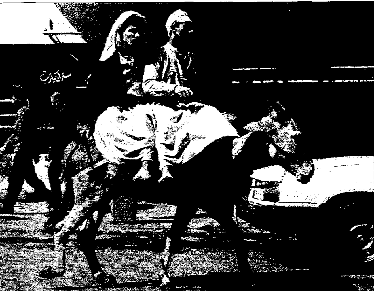
واشنطن - القدس العربي - من محمد دلخ

يبدو أن القاسم المشترك الأعظم في أوساط السياسيين الأمريكيين وخبرائهم وأوتانهم الإعلامية هذه الأيام هو الكيفية التي تمكنهم الشخص من الكابوس الذي اختلقوه عاجلاً وأجلاً وفي واشنطن التي تعين دوماً صراعات ومحاكمات سياسية بين البيت الأبيض والكونغرس يعززها ويخفي ثارها مجموعات أصحاب المصالح والضغط فإن العراق ورئيسه صدام حسين الذي تنقذ عليه كافة التقديرات ذلك بل إن يطرحونها ليس من منظور أخلاقي، بل من منظور مصالح السنين يجد للتابع ما يجري في واشنطن والشرق الأوسط للموضوعات المتعلقة بالسياسة الخارجية الأمريكية قد انحدر إلى حد لم يعد يتسم بأي بعد أخلاقي حيث تنفذ كل ما يقع.